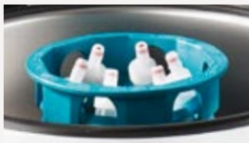
illustrated with blood collection tubes